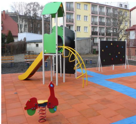
Dorota Goldewicz wych. klasy I c

Reasumując dzieci sześćioletnie chętnie uczęszczają do szkoły, zainteresowane są pracą, aktywnie uczestniczą w zajęciach. W szkole nie tylko zdobywają wiedzę, uczą się współpracy, ale również mają możliwość rozwoju swoich zainteresowań i uzdolnień.